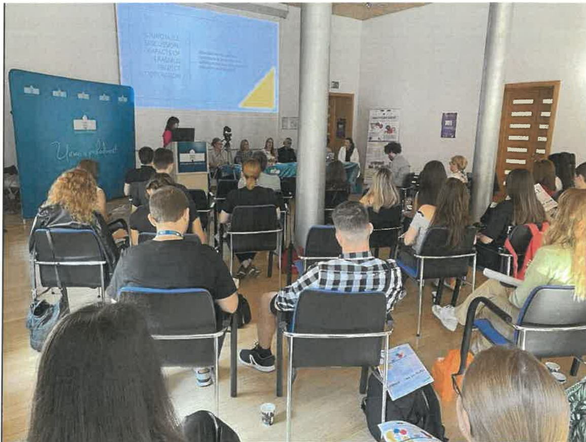
Slika 10: okrogla miza v okviru multiplikativnega dogodka