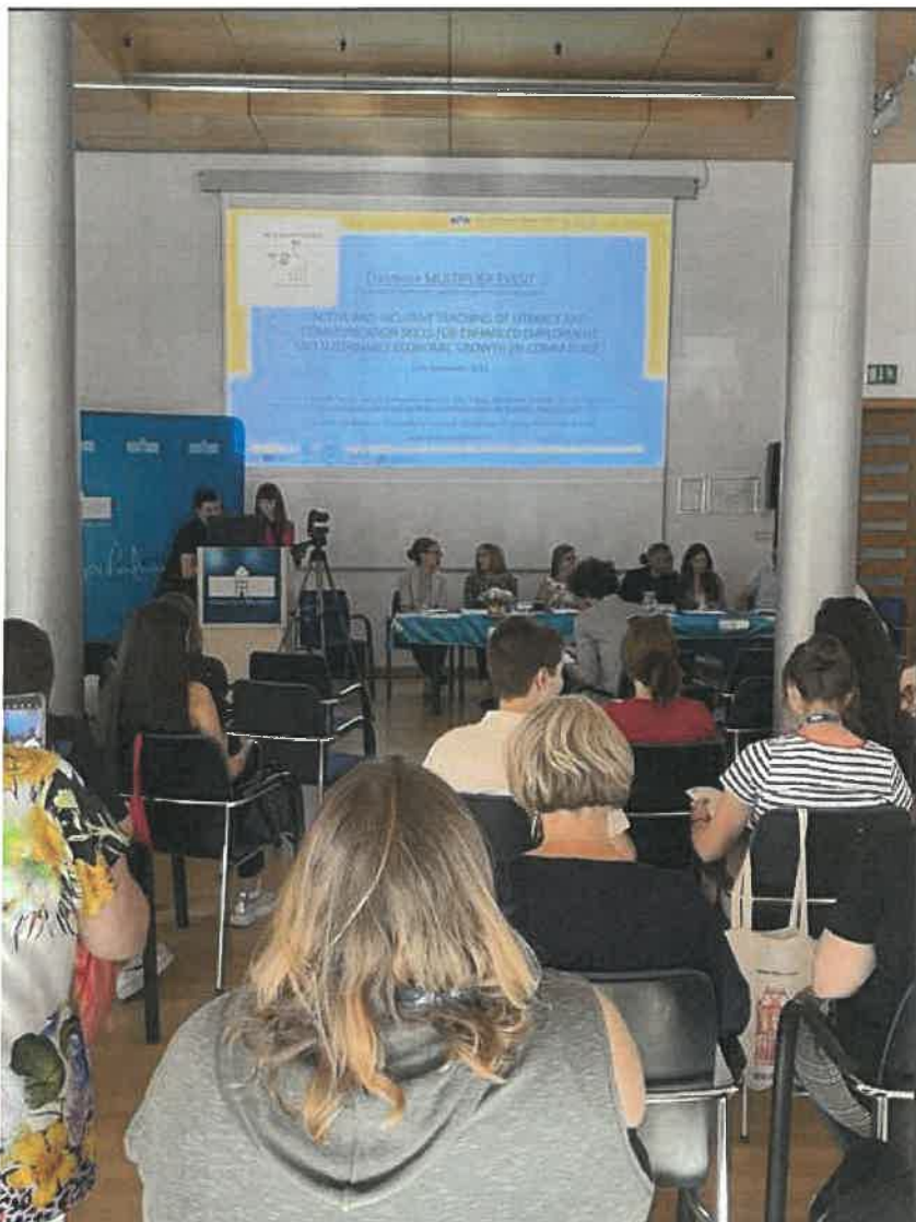
Slika 6: nared za začetek multiplikativnega dogodka in za njegov prenos