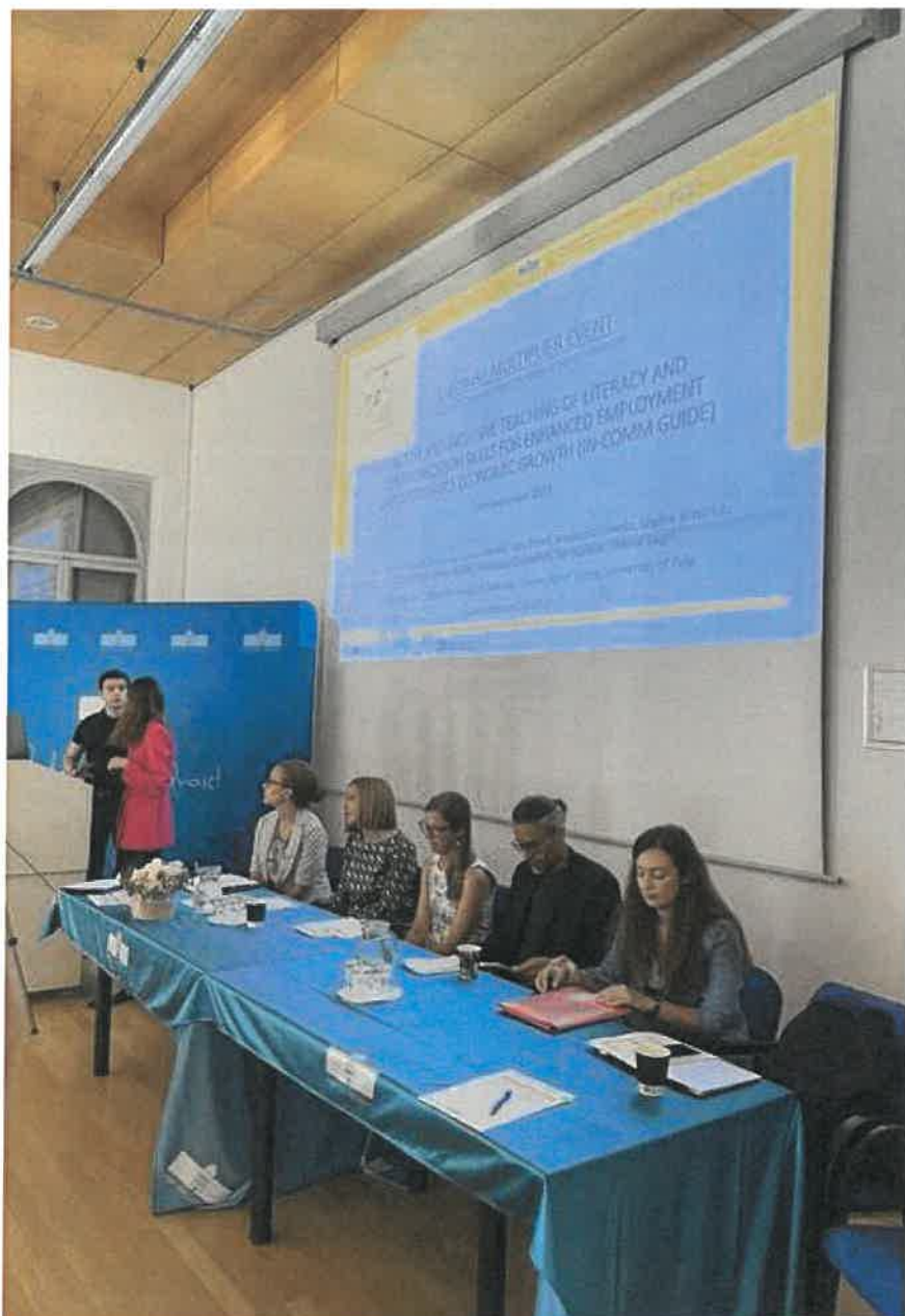
Slika 7: zadnja usklajevanja glede prenosa dogodka